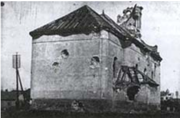
A szolnoki Vártemplom 1919-ben, a menekülő nyílással

Ebben az ostromállapotban a szolnoki Vártemplom tabernákulumában maradt az Oltáriszentség, míg a szentmisék már a ferences templomban folytak, a város némileg biztonságosabb felében. A Vártemplomot a lebombázás vagy a szélövetés veszélye fenyegette, maga az Oltáriszentség is megsemmisült volna. „Legjobban aggódnak és bántja a Pátereket, hogy a tabernákulumban ott maradt a monstrancia és a cibórium tele átváltoztatott partikuláréval. Nagyon bántaná őket, ha valami tiszteletlenség érné a Jézuskát. Ezt kellene valakinek – ha van rá mód – elhozni... Hiába panaszkodott a Páter, vállalkozó nem akadt, mert lehetetlen volt átjutni a várba... Ettől az időtől mindig csak azon gondolkoztam, hogyan menthetném meg a Jézuskát, hogy lássa, én szeretem őt!” [G.E. 2003. p. 17.]